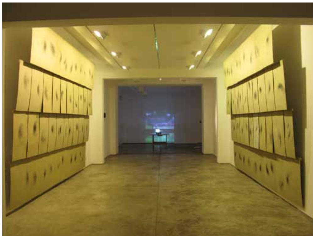
estación de lectura informal dibujos del viento I

videos y dibujos de distintos distritos en Lima ( independencia, comas, carabaylo, el agustino, ancon, ventanilla, puente piedra)