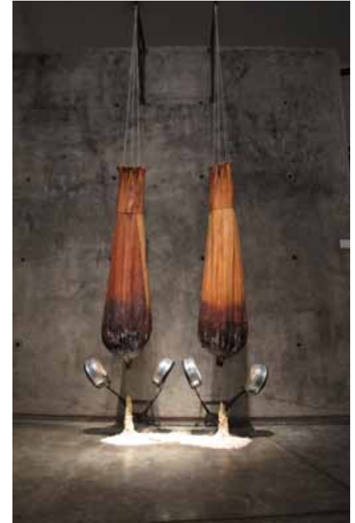
piel / memoria ii cuero, grasa animal, parafina, calentador Dimensiones variables 2007