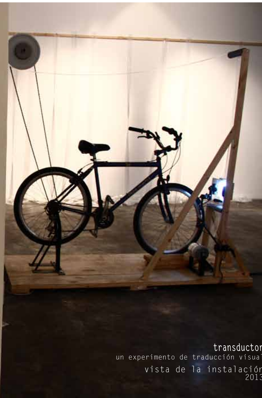
transductor un experimento de traducción visual vista de la instalación 2013