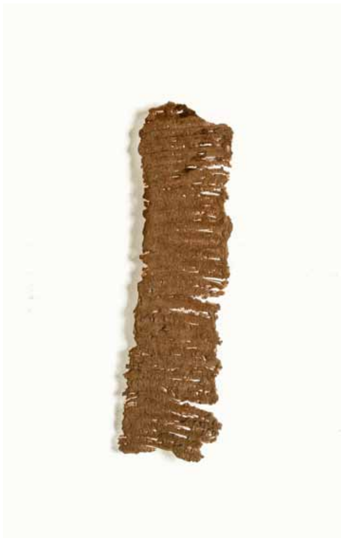
retenciones - piel de barro

Dibujo de barro en el espacio. Barro con pegamento a base de resina 2012