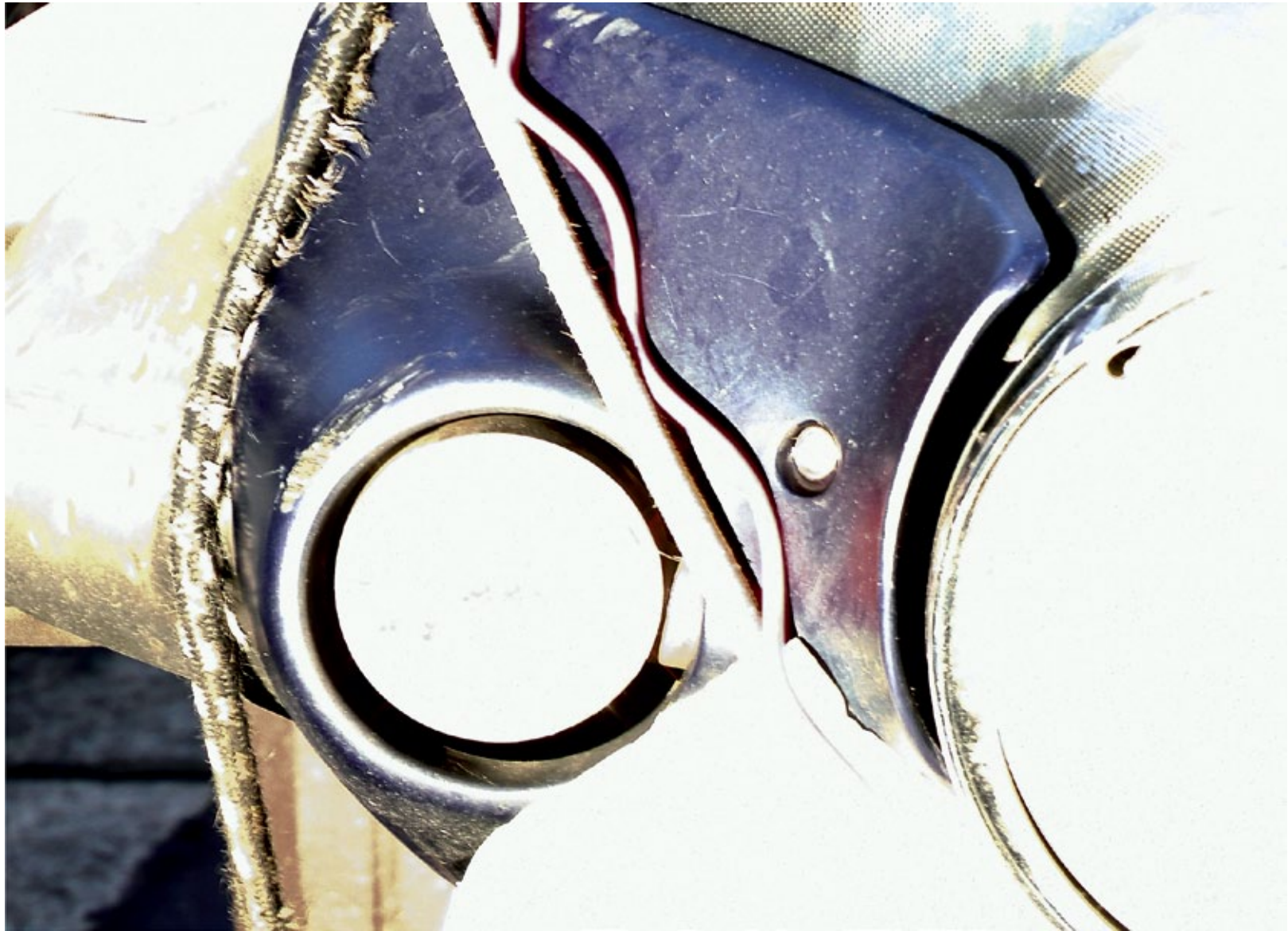
Ht W 29 90 x 120 cm Impresión digital sobre papel Epson Luster 2014